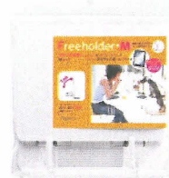
パッケージサイズ W240xD25×H270mm